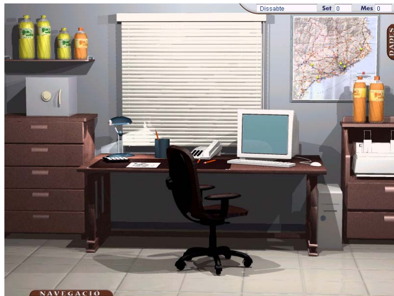
Figura 2. Imagen de del despacho. Opciones: demanda histórica; contabilidad; satisfacción clientes; etc.

Para tomar las decisiones (representadas en la tabla 3), se supone que el jugador se encuentra trabajando en la empresa (figura 2) una vez completada la producción de dicha jornada laboral, y en el momento en que sólo queda por cargar los camiones de distribución. Además de las jornadas habituales (de lunes a viernes), que pueden incluir un número máximo de horas extras, se permite trabajar los sábados, aunque esto también será contabilizado como horas extras.