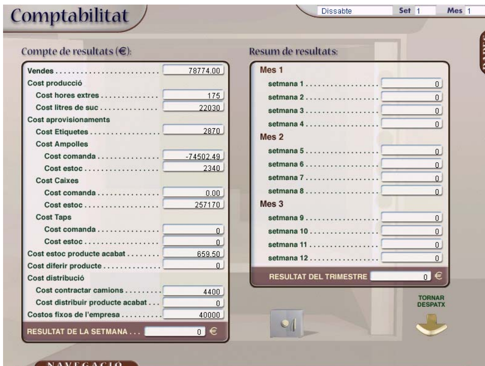
Figura 7: Pantalla de evaluación semanal de los beneficios de la empresa.

Los resultados de la aplicación indican los rendimientos y cajas producidas (figura 6); los stocks de productos acabados y de materias primas, la cuenta de resultados (figura 7) o los índices de satisfacción de clientes, cuyo valor aumenta si no se producen roturas de stock.